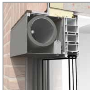
MONTAGE VOR DEM RAHMEN