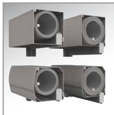
ENDSCHIENE IN DER KASSETTE VERBORGEN