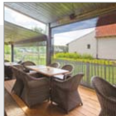
KRYSTALFENSTER IM GLASFASERTUCH